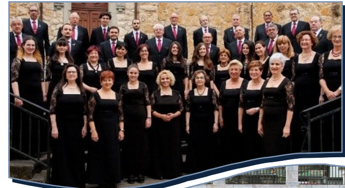
Coral Polifónica Piloñesa

www.sociedadcoral.es allegro@sociedadcoral.es