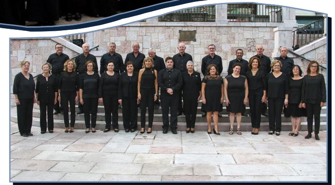
Agrupación Coral de Nava

Iglesia Parroquial de San Bartolomé de Nava